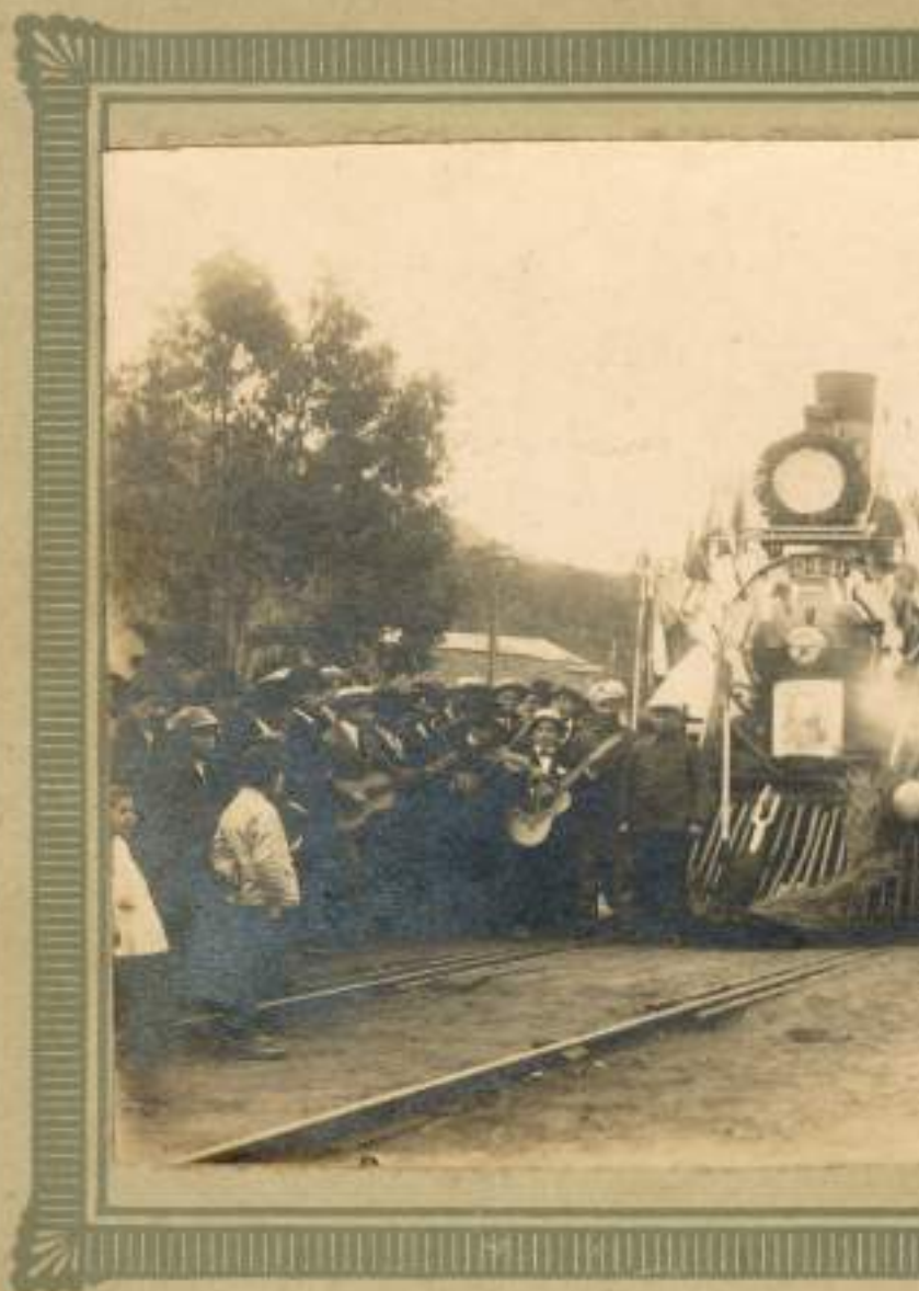
Estacion Chiguay 18 de Setiembre