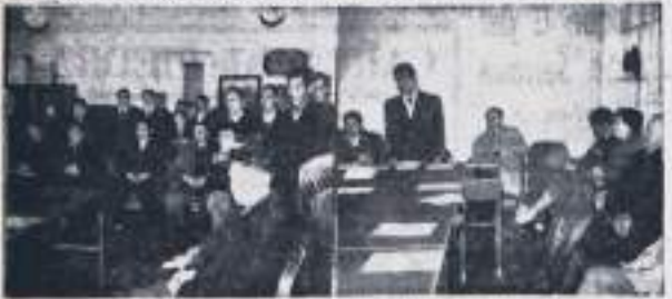
Una sesión de la reunión convocada por el Comité de Asesores de Chiguayante, a la que comparecieron el alcalde y regidores y representantes de esa localidad, para discutir la mejor forma de dar solución a los problemas de transporte que la afectan.

En esta sesión, se acordó que se solicite a la Junta Reguladora de Transportes que exija a la ETCE, cumplir el recorrido total a Chiguayante. También se acordó solicitar a la Junta Reguladora de Transportes que exija a la ETCE, cumplir el recorrido total a Chiguayante.