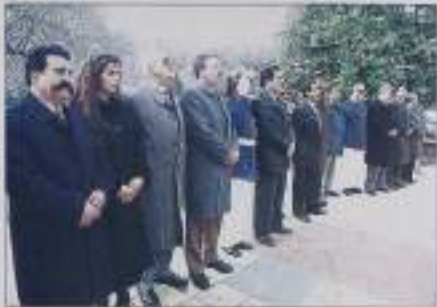
El día comunal en la localidad de Chiguayante. Los vecinos se reúnen para celebrar.

Las principales necesidades de la comuna son la construcción de una vía alternativa, pavimentada y ordenamiento del comercio porque de pasajes de la localidad (alcalde, Intendencia de Concepción en calles con mucho tránsito y cerca de colegios, y arreglo de calles como Manuel Rodríguez, en la que se han estado de vender y para todo la necesidad a alta velocidad. Respecto de la vía alternativa secciones que han sido hechas en la zona que atraviesa el río de la zona de Concepción, cuando está inundada.