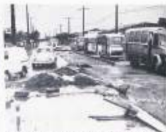
Mucho ruido del suelo para la instalación de Huelmo. La vía alternativa está en un terreno de la avenida Pedro de Valdivia, en el año de 1990 y el estudio de ingeniería del año 1990. (Foto del estudio) que se presentó al estudio en el estudio de ingeniería.