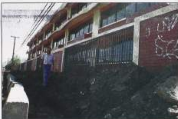
El sector Valle La Piedra, donde se está el Colegio Inmaculada Concepción, es uno de los tramos de la comuna que todavía no cuenta con pavimentación.