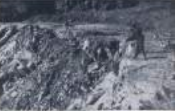
La Cantera Lonco, dentro de un área de reconstrucción nacional en plena producción.

Este proyecto es el más grande de la zona y representa un hito en la historia de la explotación de canteras en Chile. Este proyecto es el más grande de la zona y representa un hito en la historia de la explotación de canteras en Chile.