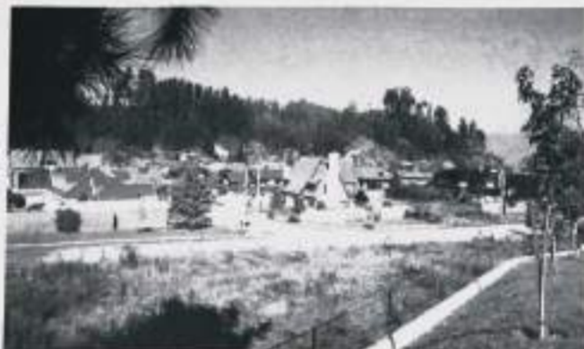
El nuevo plano regulador de Chiguayante, que determinará el desarrollo urbano de la comuna durante los próximos 10 a 15 años, busca potenciar el concepto residencial de la localidad.