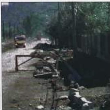
El año 2001 está contemplada la prolongación del pavimento de O'Higgins. Actualmente, sólo se efectúan trabajos de instalación de veredas.

única contemplada para este año. A través de los programas de pavimentación participativa y de mejoramiento de barria, el municipio está abocado a disminuir el déficit en alcantarillado y pavimentación, cercano al 40%.