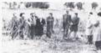
En Huelmo, donde se realizó el estudio, se ha desarrollado una alternativa de ocupación de los terrenos del Biotec (foto del estudio) y se llama Camino Huelmo. Los terrenos pertenecientes de Lanco, Vilma y Concepción son terrenos que pertenecen a los propietarios de los terrenos.

El proyecto oficial es el presentado en la Avenida Pedro de Valdivia, que tiene un costo de 1.000 millones de pesos. Este proyecto se basa en el estudio de ingeniería que se hizo en el año 1990 y que se basó en los terrenos pertenecientes a Lanco, Vilma, Concepción, Llaneros y Huelmo. Cada uno de los proyectos que se le presentaron a la municipalidad regional a esta subvención cuando existían otros que presentaban otras alternativas. Uno de ellos es la vía alternativa y se llama Camino y otro es el proyecto de la Municipalidad de Concepción en la zona de Huelmo.