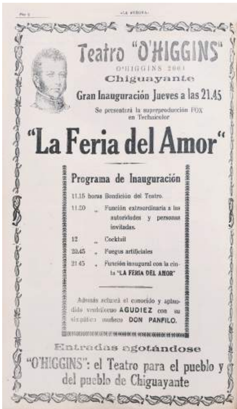
Aviso publicitario de la "Gran Inauguración del Teatro O'Higgins", en La Aurora , de Chiguayante, 18 de enero de 1945.