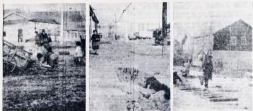
MAL ESTADO DE LAS CALLES. — Para los vecinos del barrio de la Avenida Manuel Rodríguez, desde el Ejercito, la prolongación de Santa y Arica, etc., se ha convertido en un problema, especialmente durante el invierno. El barro y los charcos dificultan el paso de los vehículos hasta los comercios que existen en ese sector. (Foto de arriba, de parteras y costureros, hermano, etc.). EN EL CRANDEJO, a la izquierda, los terrenos que van a tener dependencias de la municipalidad de la baronesa, esperan desde su fundación en Ejercito con el fin de tener los locales que tendrán para el barrio de M. Rodríguez, por último, las casas de la población de encontrarse en Santa con Santa Bárbara.