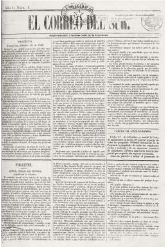
Ejemplar inicial del periódico El Correo del Sur , del 9 de septiembre de 1919. Primer órgano de la prensa regional que difundió noticias del pueblo de Chiguayante.