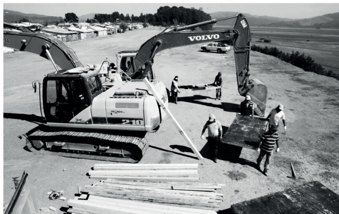
Con una inversión de $1.549 millones, se busca recuperar espacios que estaban abandonados y considerados por la comunidad como una amenaza.

Diversos problemas administrativos influyeron en el retraso del inicio de obras. La inversión contemplada es de 1.500 millones de pesos.