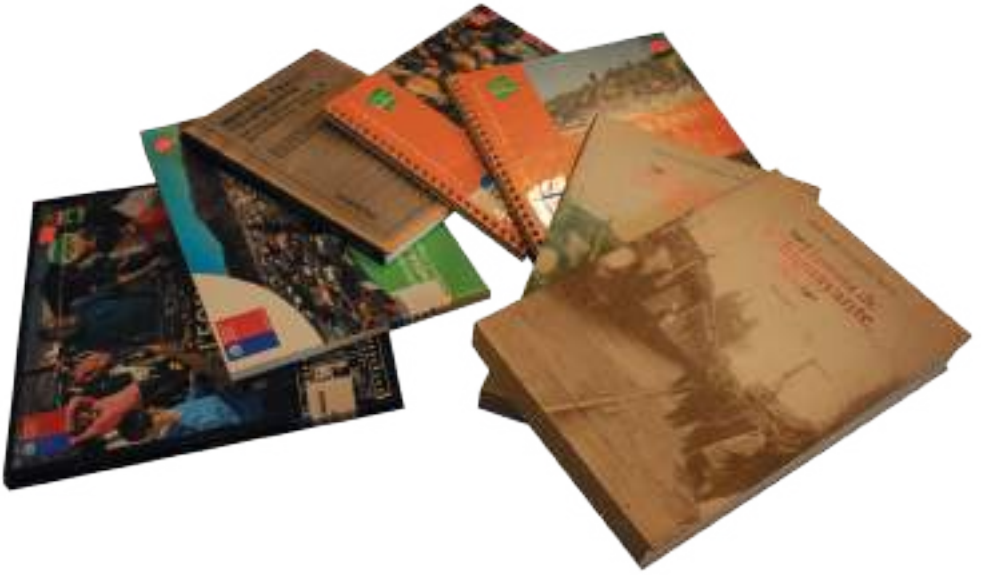
Libros que rescatan el pasado y el patrimonio de Chiguayante.

diversos barrios 3 , entre muchos otros temas. De manera que nos propusimos un abordaje diferente, más gráfico y que diera a los lectores el acceso directo a la fuente, para que, como en un viaje en el tiempo pudieran conocer - o revivir- los eventos que hemos seleccionado. Naturalmente, se trata de una muestra muy acotada, pero significativa, de personas, lugares, obras e instituciones, que han hecho la historia comunal. En ningún caso pretende ser exhaustiva, así que desde ya solicitamos excusar las omisiones.