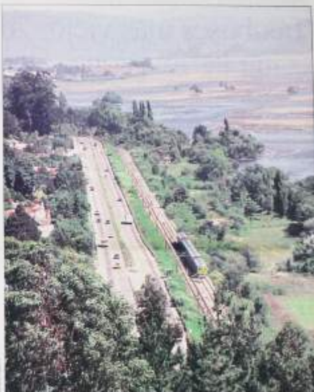
Las obras de la Costanera a Chiguayante contemplarán una carretera de 14,7 kilómetros, una defensa fluvial y el relleno de 250 hectáreas que serán destinadas a proyectos agropecuarios.

El ingreso del sector privado que se impulsará, las obras consistirán en que a cambio de la inversión, recibirá gran parte de las hectáreas a recuperar con los riego, las cuales serán destinadas a desarrollo del proyecto agropecuario.