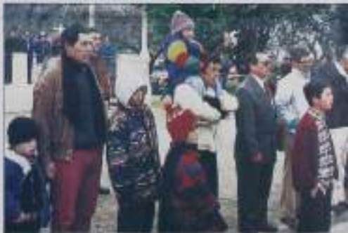
Desfilando la baja temperatura de la mañana invernal los vecinos de Chiguayante se integran al programa de celebración.