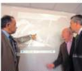
En el edificio regional del ADF se firmó el contrato de obra.

La oferta económica de la empresa Dragados S.A. es de 300 millones de pesos, lo que representa una reducción del 12,75 por ciento respecto a la oferta más baja de las otras 12 empresas que participaron en la licitación.