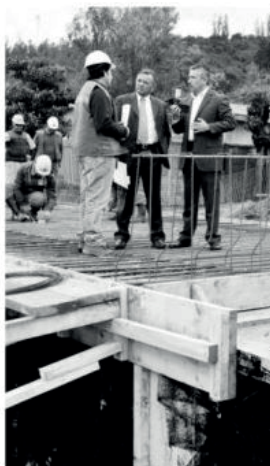
Autoridades supervisaron ayer los trabajos.

Agregó que se trabaja en el proyecto de la última etapa, el que tendrá una inversión secto-