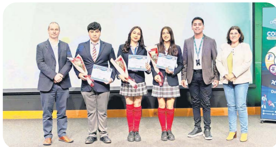
Organización, voz y propuestas para construir ciudad y comunidad. Jóvenes del Consejo Consultivo Infanto Juvenil de la Oficina Local de la Niñez (OLN) del municipio, recibieron su certificado del Taller Agentes de Cambio, realizado en colaboración con Duoc UC, sede San Andrés.