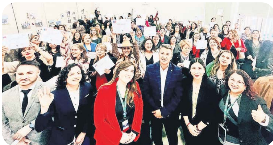
Empoderamiento en acción: 105 Mujeres Jefas de hogar recibieron su certificación tras un año de formación junto al SernamEG y el municipio. Capacitaciones en gestión, marketing digital y salud mental, entre otros, les entregaron herramientas para su autonomía económica y personal.