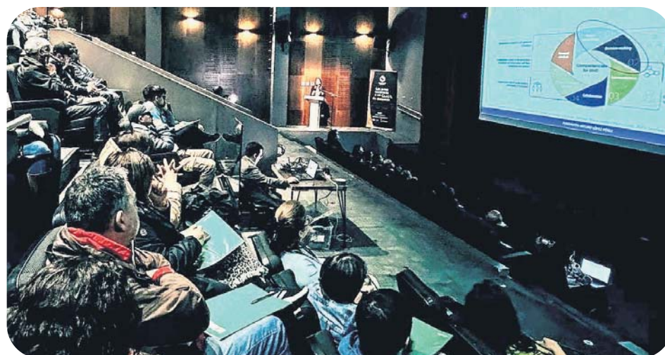
Más de 200 profesionales y estudiantes de educación superior del área de la salud participaron en las VII Jornadas de Atención Primaria y Salud Familiar. Se trató de un espacio para compartir conocimientos y experiencias que permitan optimizar la atención que se brinda en los Cesfam.