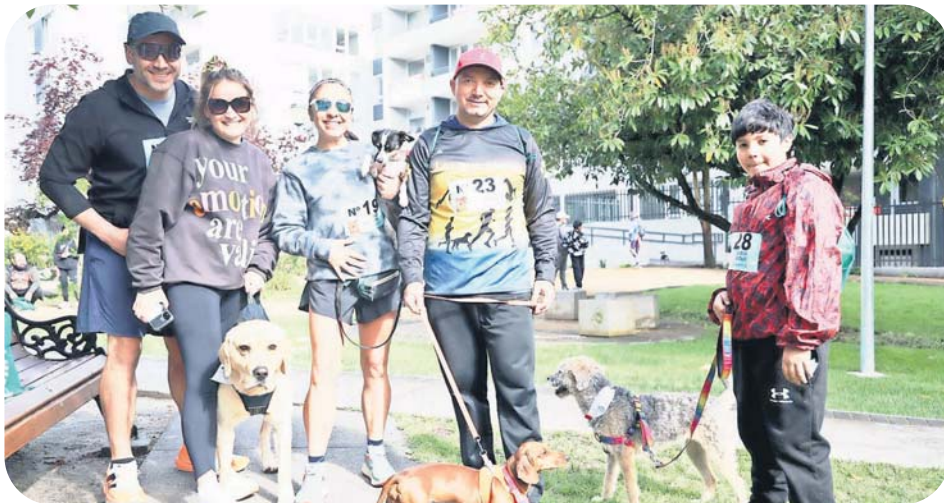
Chiguayante vivió una jornada inolvidable junto a sus mascotas. Con alegría, energía y mucho cariño, se realizó la Corrida Perruna Chiguayante 2025 que reunió a decenas de familias en el Parque Los Castaños para celebrar el Día de los Animales.

El avance de Chiguayante se manifiesta en distintos aspectos de la vida comunitaria, tal como lo demuestran las siguientes actividades.