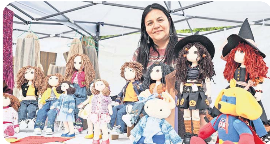
Una jornada llena de color, música y tradiciones, organizada por el equipo de la Oficina de Turismo, convocó a emprendedores, artesanos y artistas locales en un verdadero "Encuentro de dos mundos", en la Feria Temática que se desarrolló en la Plaza de Chiguayante.