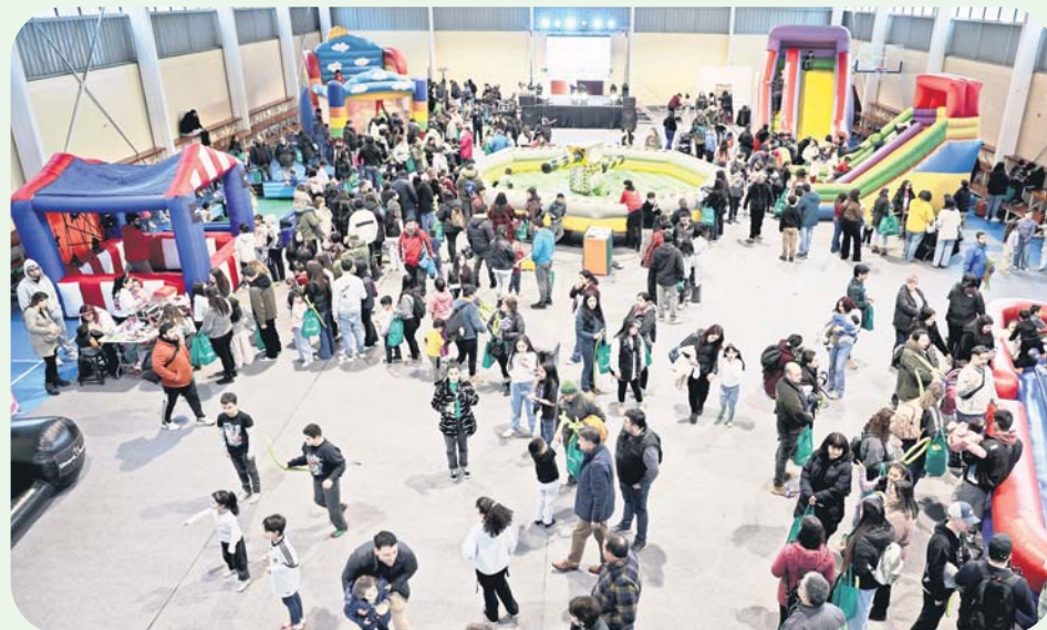
Espectáculos infantiles y diversos juegos inflables dieron vida a la jornada en el gimnasio del Liceo Obispo San Miguel