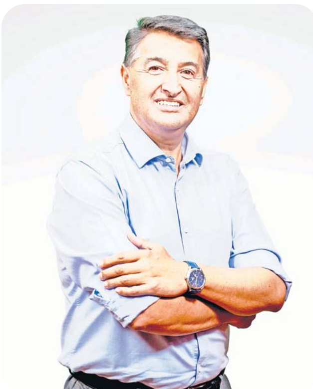
Jorge Lozano Z. Alcalde de Chiguayante

La extensión de este terreno nos permite imaginar múltiples oportunidades, siempre manteniendo expectativas realistas, pero sin dejar de lado los anhelos de nuestras chiguayantinas y chiguayanti-