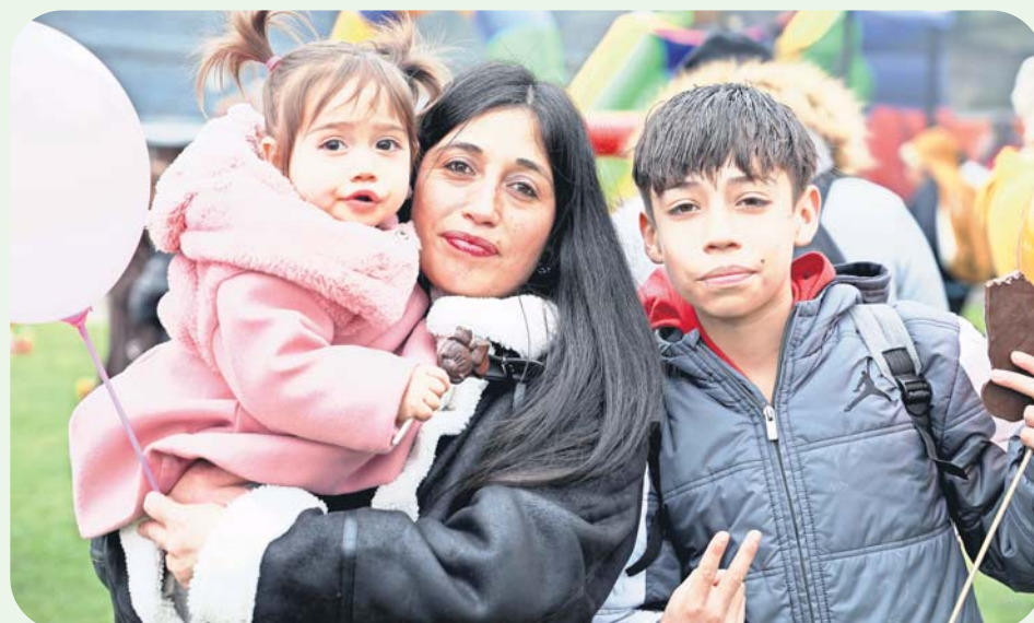
En imágenes, algunas de las alegres familias que celebraron a lo grande en las actividades, que el municipio preparó para celebrar a los regalones de la casa.