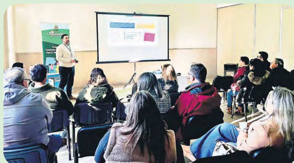
Junto al Instituto Nacional de la Juventud, la Oficina Municipal de Jóvenes efectuó la charla "Deporte y Salud Mental", instancia en la que se abordó la importancia de la actividad física como factor protector para prevenir o combatir problemas de ansiedad, depresión u otros problemas que afectan la salud mental de los adolescentes.