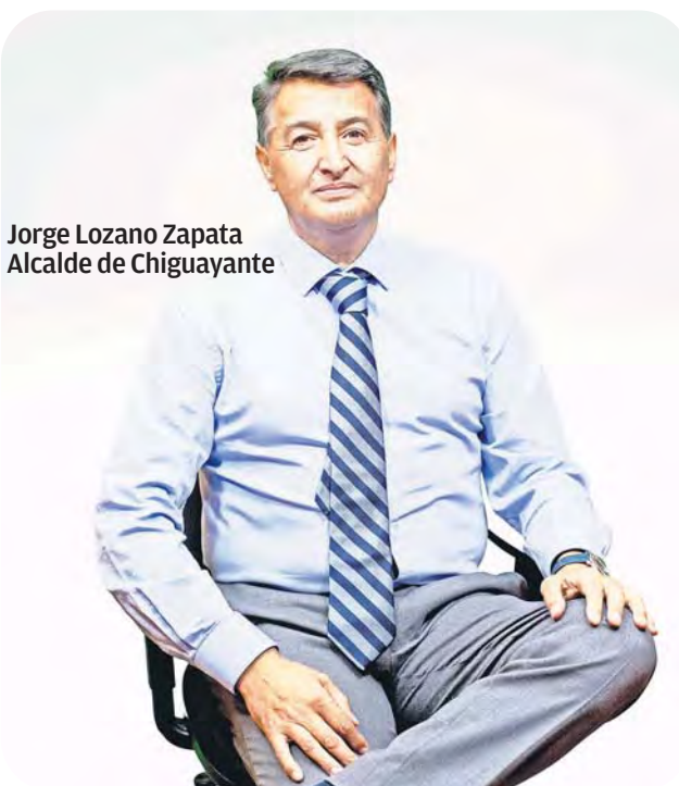
Jorge Lozano Zapata Alcalde de Chiguayante

Pronto les compartiremos más detalles, porque esta es una decisión que se construye entre todas y todos. ¡Chiguayante avanza contigo!