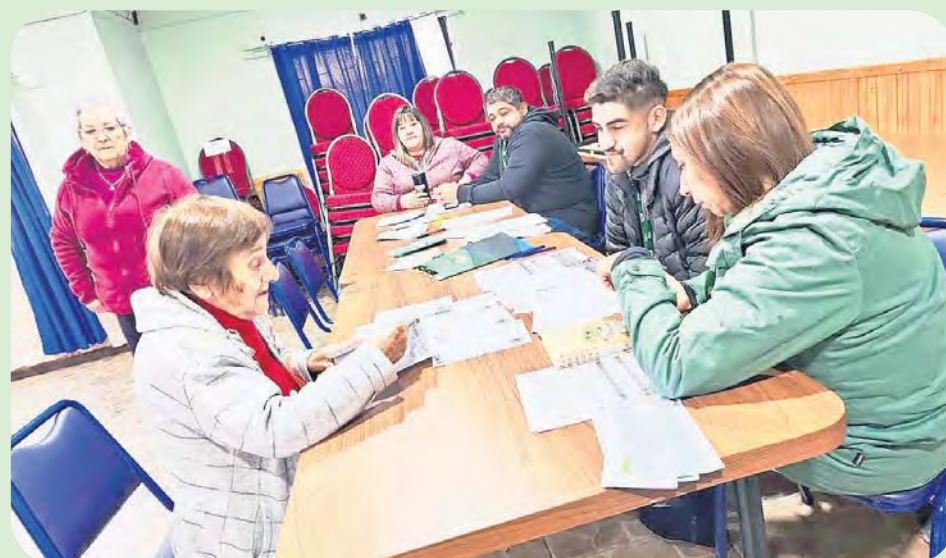
Servicios municipales en los barrios. Registro Social de Hogares, información de subsidios, orientación a personas mayores o con discapacidad, entre otros, formaron parte de los servicios que las oficinas de DIDECO llevaron a las juntas de vecinos Villa La Pradera 1, Valle La Piedra 2, entre otras.