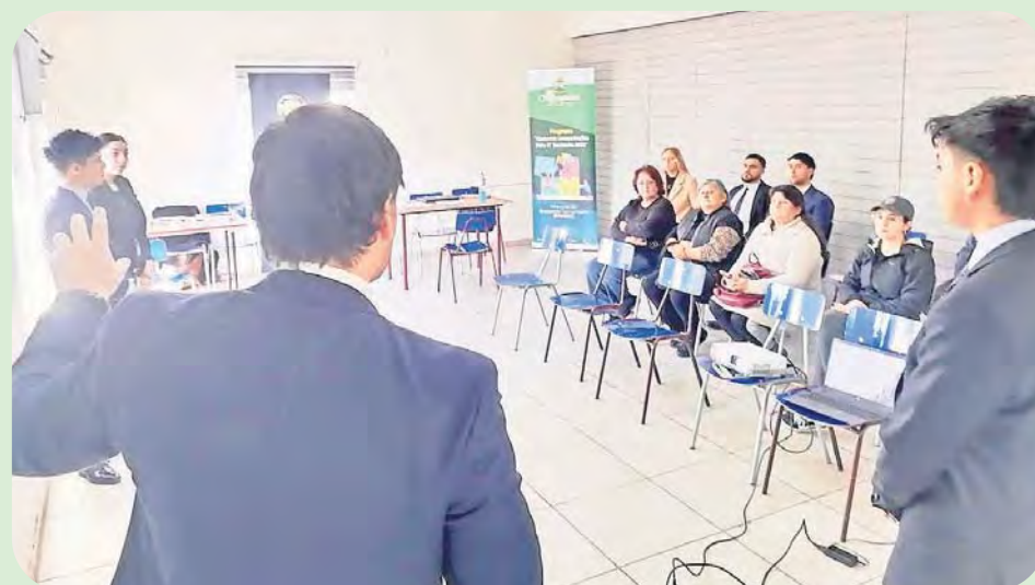
Un acuerdo entre la Facultad de Derecho y Ciencias Sociales de la Universidad San Sebastián y el municipio, permitió entregar atención jurídica gratuita a vecinos y vecinas. Dudas acerca de pensión de alimentos, herencias, entre otros temas legales fueron los más consultados.